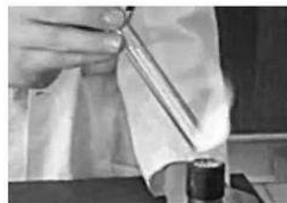
3 Důkaz vodíku - „štěknutí“